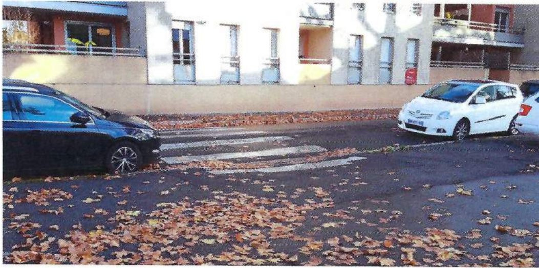
Sortie de Contre-allée pour les véhicules qui enjambent le passage piéton