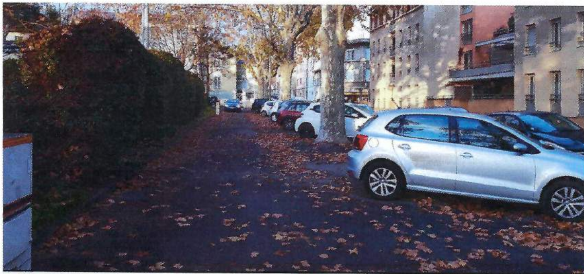
Zone mixte Circulation/Piétons le long de la contre-allée