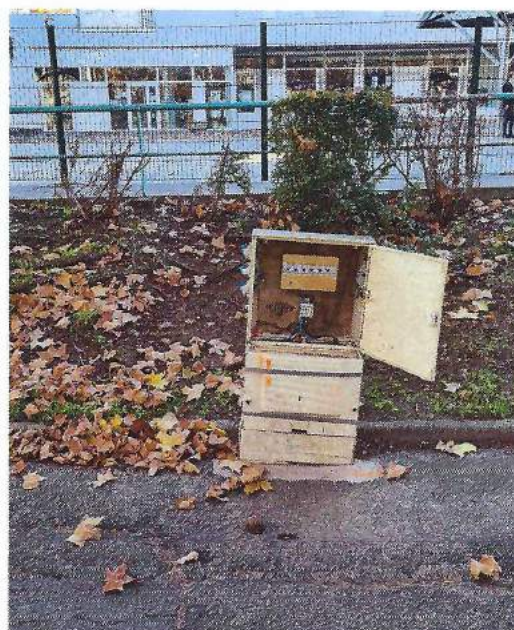
Borne électrique ouverte