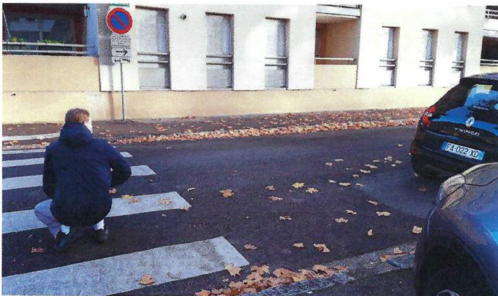
Faible Visibilité à la traversée des passages piétons

Les photos ci-dessous illustrent plusieurs de ces points.